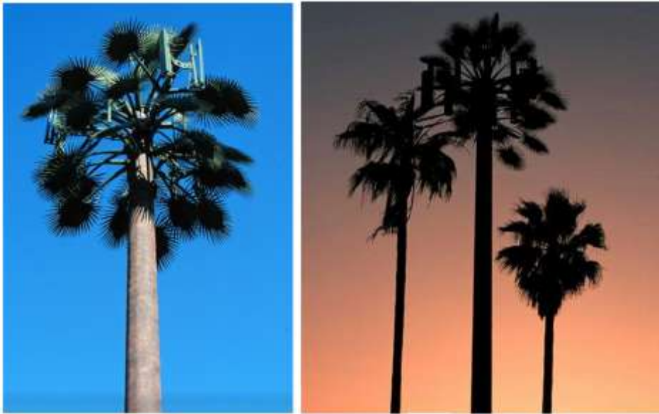
Figura 3 Torres camufladas estilo palmera datilera [3].

En la figura 3 y 4 se muestran torres estilo Palmera, utilizadas para telefonía celular, instaladas en zonas costeras.