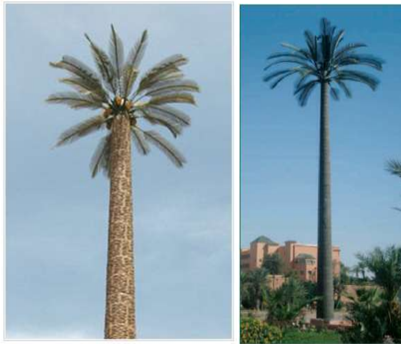
Figura 4 Torres camufladas estilo palmera con cocos [2].

La figura 5 muestra el montaje de los equipos de telecomunicaciones en la copa de una torre estilo palmera.