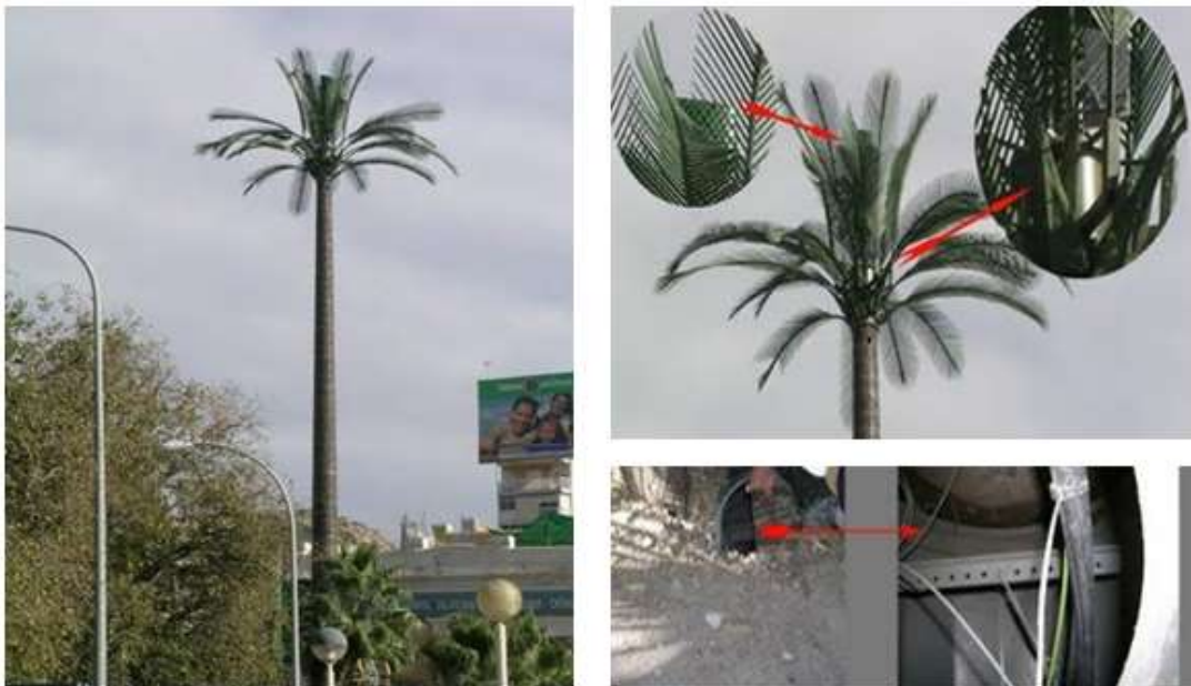
Figura 8 Camuflaje de torre de telefonía celular instalada en la Ciudad Alicante en España. [1]

A nivel internacional, se han instalado diferentes tipos de torres mimetizadas donde cada una se adapta al ambiente que lo rodea. En la ciudad de Alicante de España, se implementó una torre con antenas de telefonía celular, como se muestra en la figura 8.