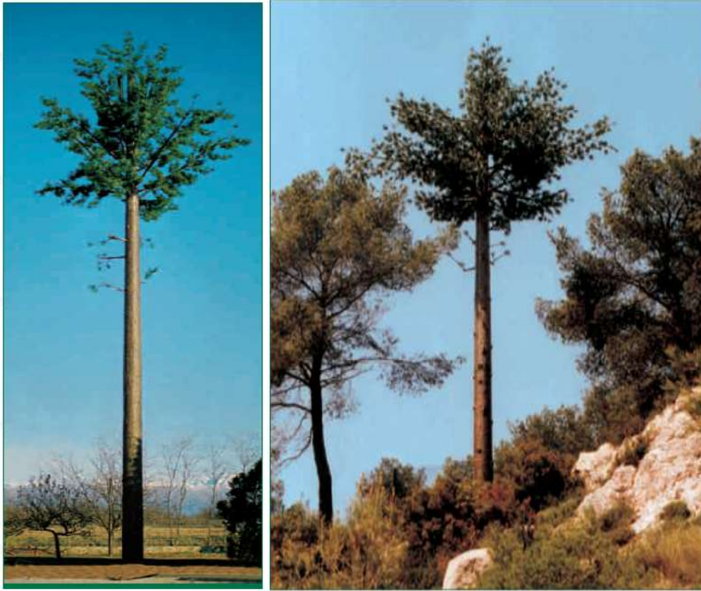
Figura 1 Torres camufladas estilo pino [2].

figura 2, se muestra un montaje de los equipos de telecomunicaciones en la torre camuflada.