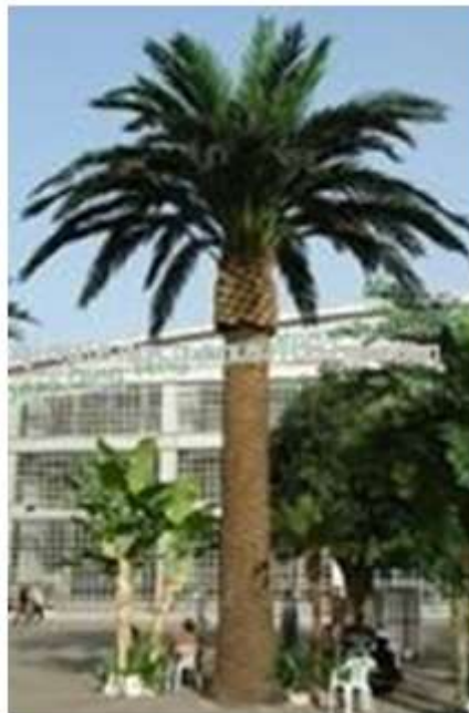
Figura 10 Camuflaje de torre de telefonía celular en Mailand Shandong China. [5]

En la figura 10 se muestra una estructura de comunicaciones tipo Palmera, ubicada en Shandong China.