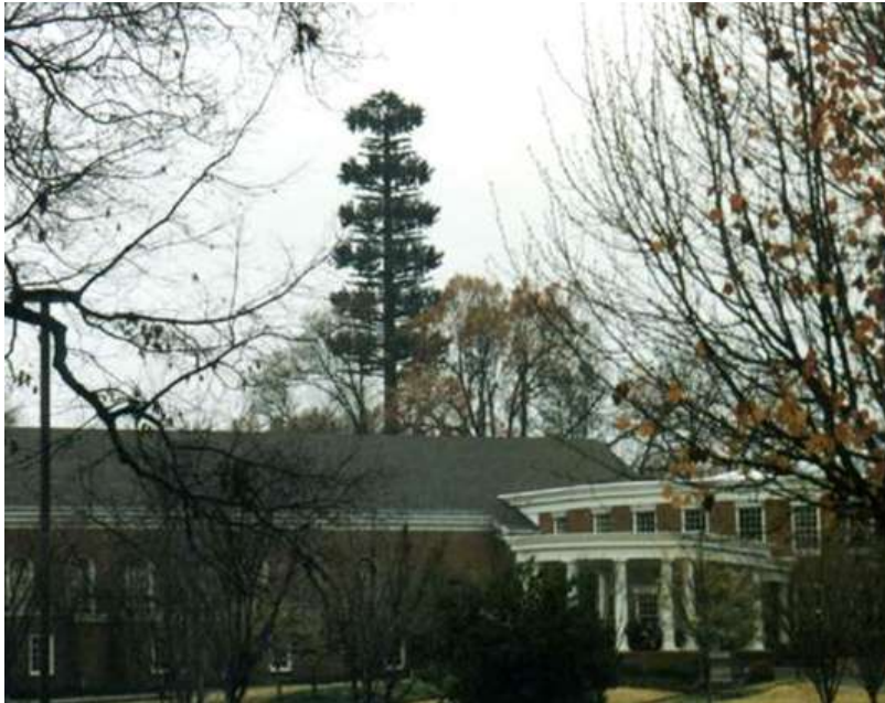
Figura 9 Camuflaje de torre de telefonía celular instalada en Tennessee, Estados Unidos. La estructura esta compartida con seis proveedores de telefonía celular. [3].

En la figura 10 se muestra una estructura de comunicaciones tipo Palmera, ubicada en Shandong China.