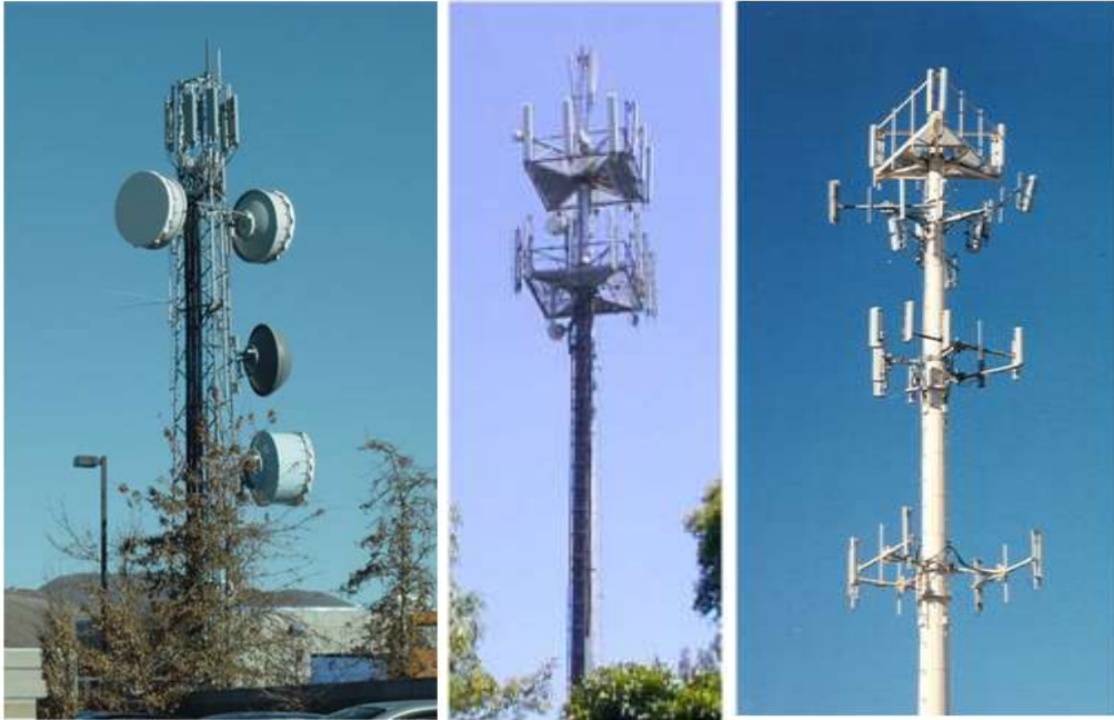
Figura 1 Torres y antenas de telecomunicaciones típicas [6].

Es importante recalcar que los trabajos de mimetización de las torres de telecomunicaciones deben garantizar la total transparencia radio-eléctrica, es decir, producir un efecto mínimo en el coeficiente de reflexión y aislamiento de las antenas, lo que permite una correcta emisión y recepción de la señal.